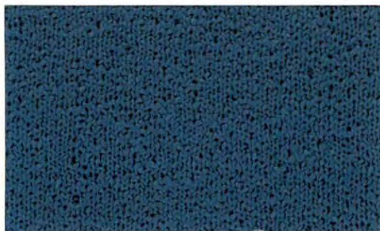
015 Baltic Blue