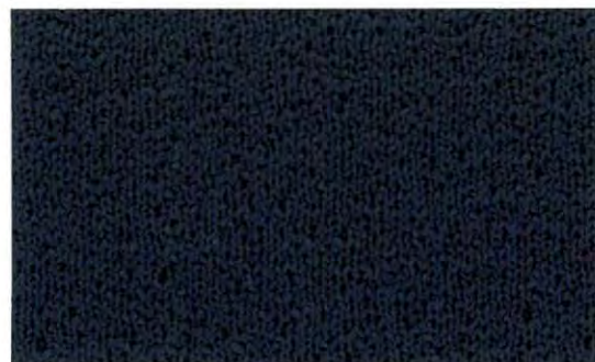
002 Monarch Blue