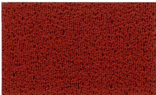
010 Dark Crimson